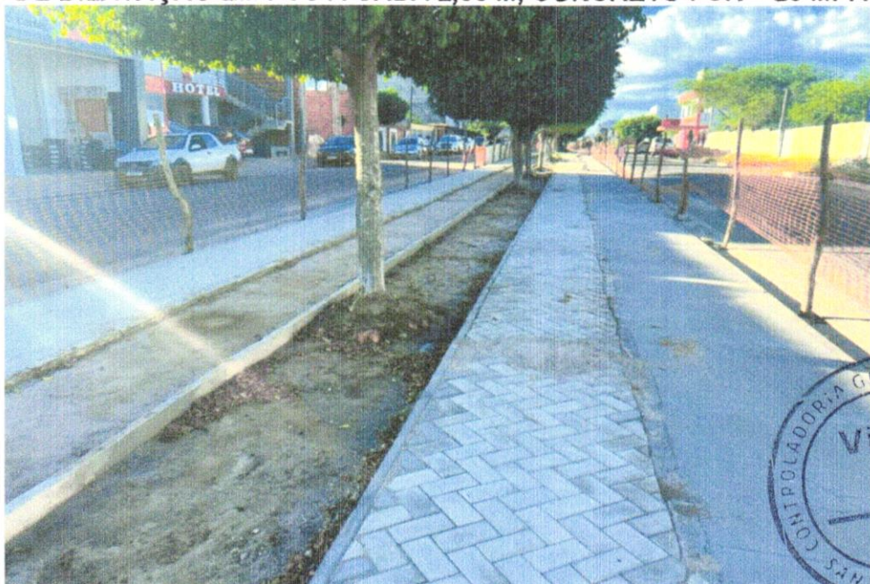
FOTO 04 - Pavimentação em bloco de concreto vibroprensado, intertravado, cor natural, 10x20cm, e=6cm, 46un/m 2 , NBR9781, Fck(min)=35MPa, sob coxim areia grossa compactada c/ placa vibratória, e(comp.)=6cm, rejuntado c/ areia fina