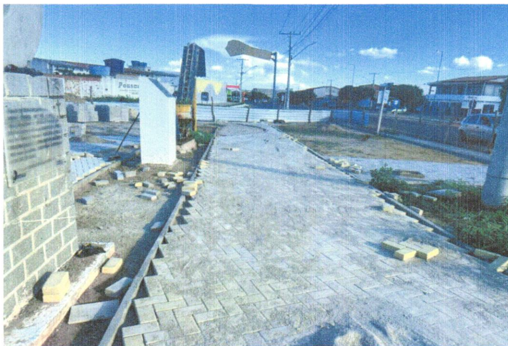
FOTO 07 – Pavimentação em bloco de concreto vibroprensado, intertravado, colorido, 10x20cm, e=6cm, 46un/m 2 , NBR9781, Fck(min)=35MPa, sob coxim areia grossa compactada c/ placa vibratória, e(comp.)=6cm, rejuntado c/ areia fina