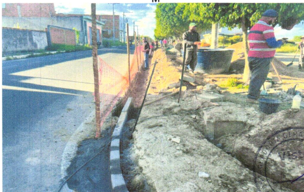
FOTO 02 – ESCAVAÇÃO MANUAL DE VALA COM PROFUNDIDADE MENOR OU IGUAL A 1,30 M. E GUIA (MEIO-FIO) EM TRECHO RETO, CONFECCIONADA EM CONCRETO PRÉ FABRICADO, DIMENSÕES 100X15X13X20 CM (COMPRIMENTO X BASE INFERIOR