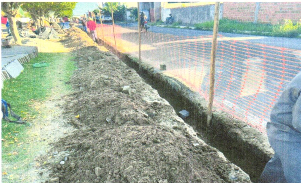
FOTO 01 – ESCAVAÇÃO MANUAL DE VALA COM PROFUNDIDADE MENOR OU IGUAL A 1,30 M